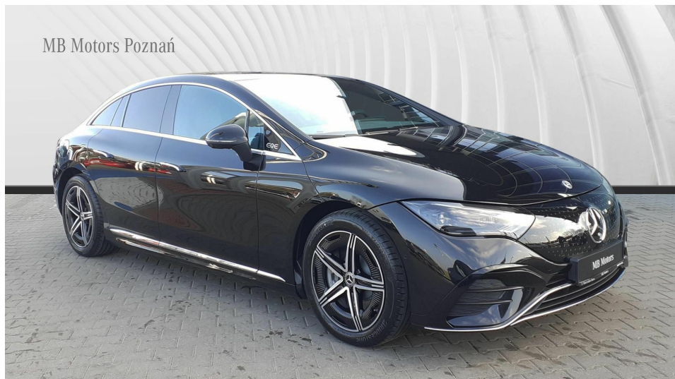
MB Motors Poznań