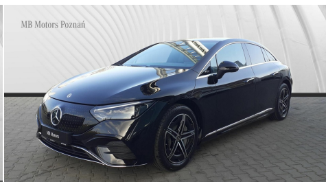
MB Motors Poznań